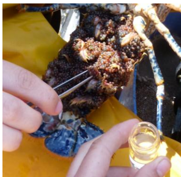
Cymryd wyau ar gyfer dadansoddiad genetig

Rydym yn dod i'r amser honno o'r flwyddyn pan fyddwn yn dechrau gweld digonedd o gimychiaid benywaidd yn llawn wyau. Byddwn yn ailddechrau casglu cimychiaid a samplau o wyau ar gyfer astudiaeth o geneteg tadolaeth. Ym mis Mehefin aethom allan gyda Devon a Severn IFCA i Ynys