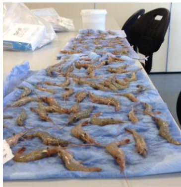
Palaemon serratus , yn y labordy.

Mae myfyrwyr sy'n astudio ar gyfer gradd Meistr wedi bod yn samplo poblogaethau gorgimychiaid drwy gydol yr haf o amgylch arfordir Ynys Môn a Sir Benfro. Ar hyn o bryd maent yn edrych ar: cymhareb rhyw, amllder maint a llawer o newidynnau amgylcheddol yn y gobaith y gallant benderfynu dau beth: pryd a ble mae'r recriwtiaid newydd yn cyrraedd a hefyd beth yn y cynefinoedd gyda'r glannau mae gorgimychiaid yn ei weld yn ei hoffi gymaint (cymhlethdod ffurfiannol, halwynedd, tymheredd etc.). Maent bron wedi cwblhau eu holl waith labordy ac ar hyn o bryd yn ysgrifennu eu traethodau ar gyfer gradd Meistr ar y pwnc hwn. Bydd y canlyniadau ar gael yn fuan!