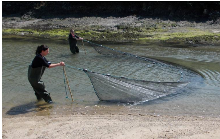
Rhwyd Seine yn chwilio am grŵp oedran 1 < o ddraenogiaid .