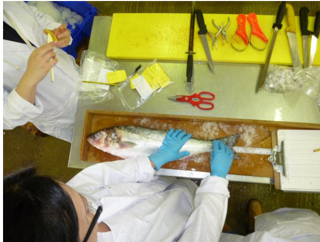
Cymryd samplau o'r cen, mesur draenogyn môr a chasglu gonadau yn y diwydiant prosesu.

dymuno cymryd rhan, yna cysylltwch â ni os gwelwch yn dda. Ni wnawn ymyrryd yn eich gwaith, yr unig beth y byddwn ei angen yw cornel ble gallwn fesur y draenogyn, torri darn bach o'r asgell, ychydig o gen a lle mae'n bosibl cymryd samplau o'r perfedd a'r gonadau.