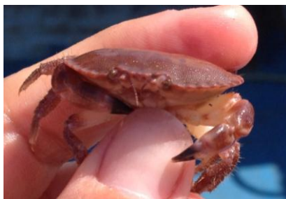
Cranc coch ifanc, Cancer pagurus .